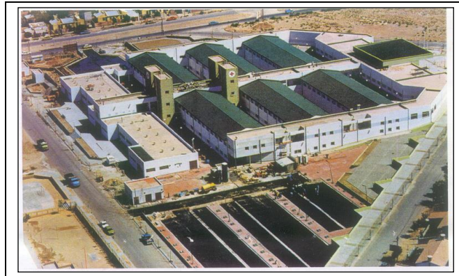
El Hospital Dr. Horacio Heller su etapa de construcción

El proyecto del Hospital Dr. Horacio Heller se remonta formalmente al 15 de abril de 1987, fecha en la que se firma el Convenio de Participación entre el Ministerio de Salud y Acción Social de la Nación y el Gobierno de la Provincia del Neuquén, relacionado con la ejecución del "Programa de Rehabilitación de la Infraestructura de Salud" del que forma parte esta provincia.